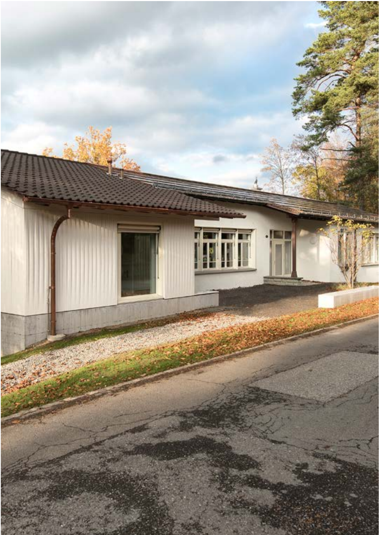
Neubau Kindergarten Aare Nord, Aarau