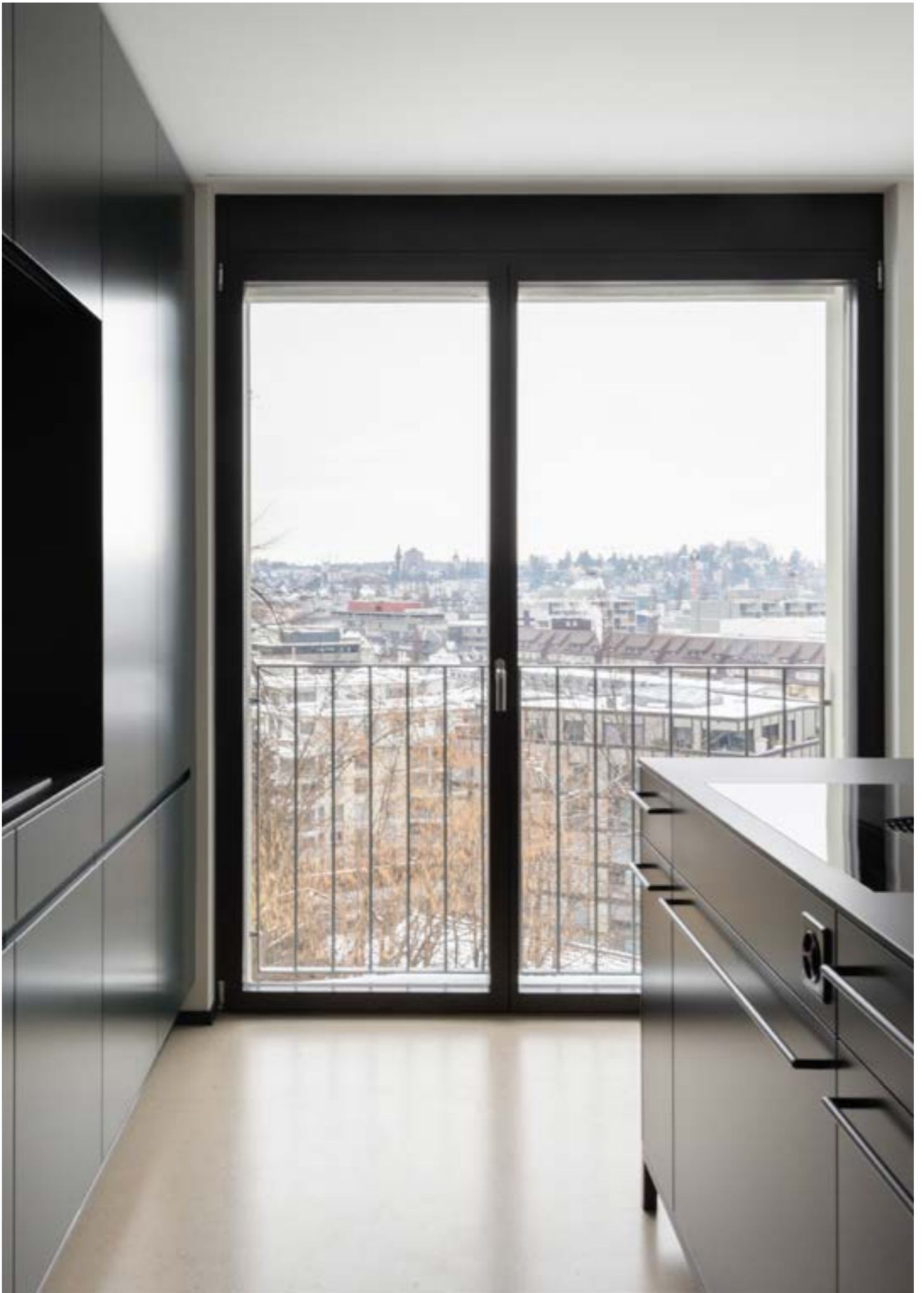
Innenausbau Eigentumswohnung, Luzern