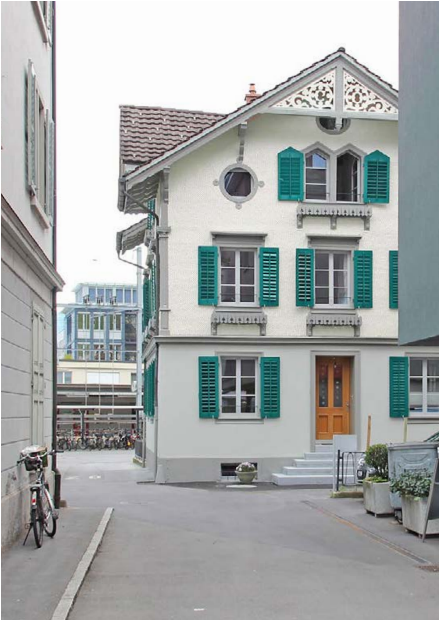
Gesamtsanierung EFH, Stans