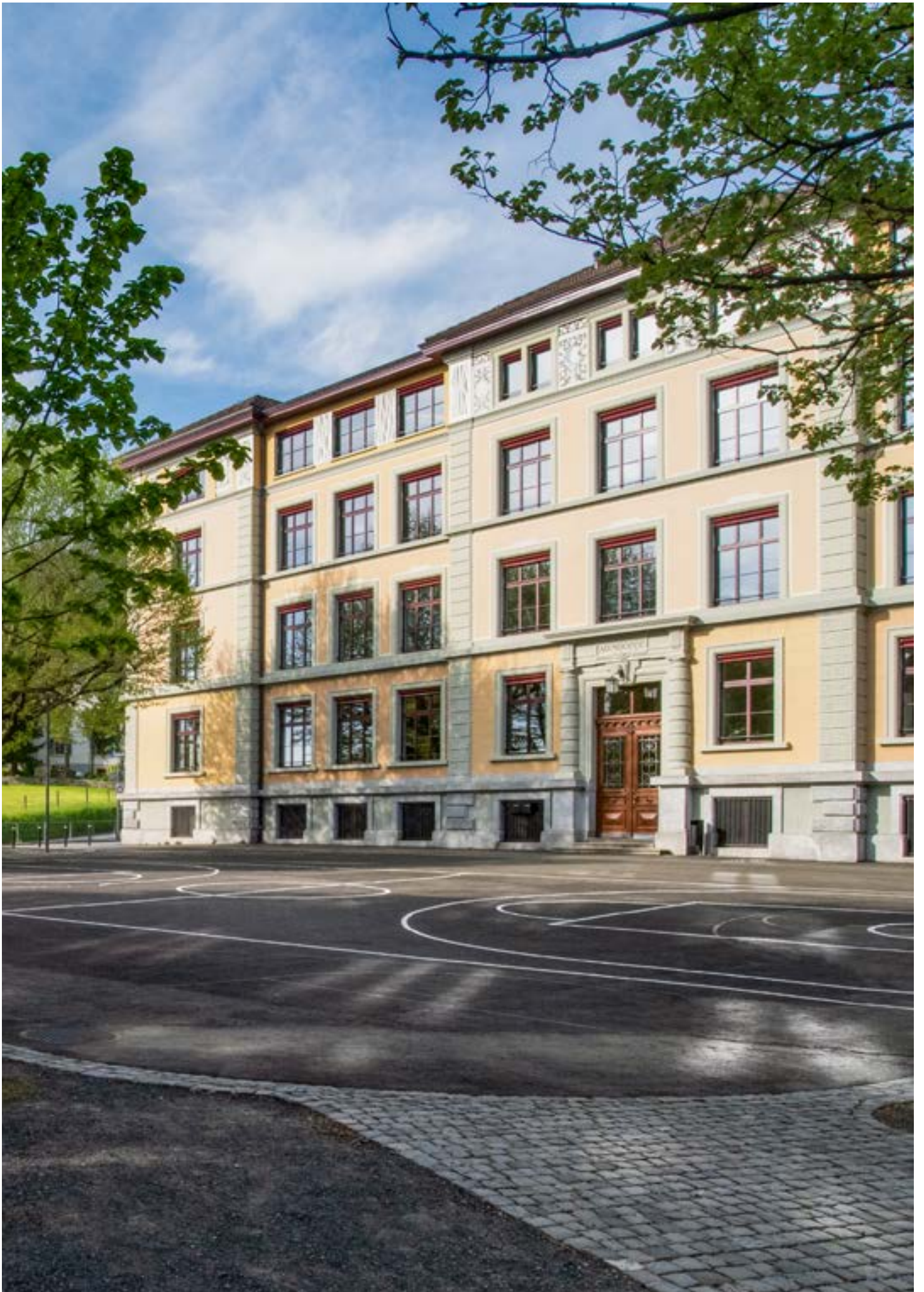
Gesamtsanierung Schulhaus Kirchbühl 1+2, Kriens