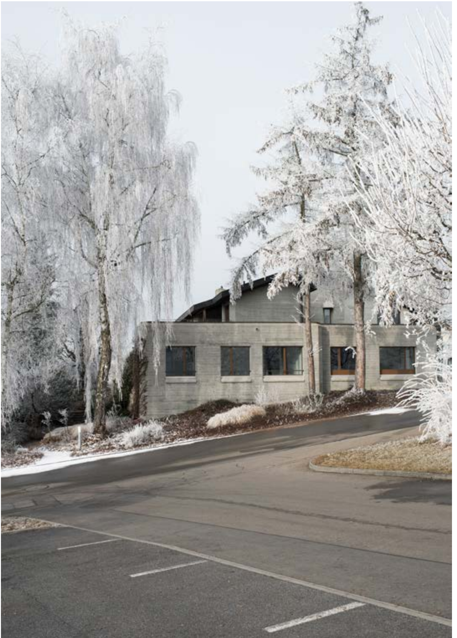
Umbau Arztpraxis in Wohnung, Buttisholz