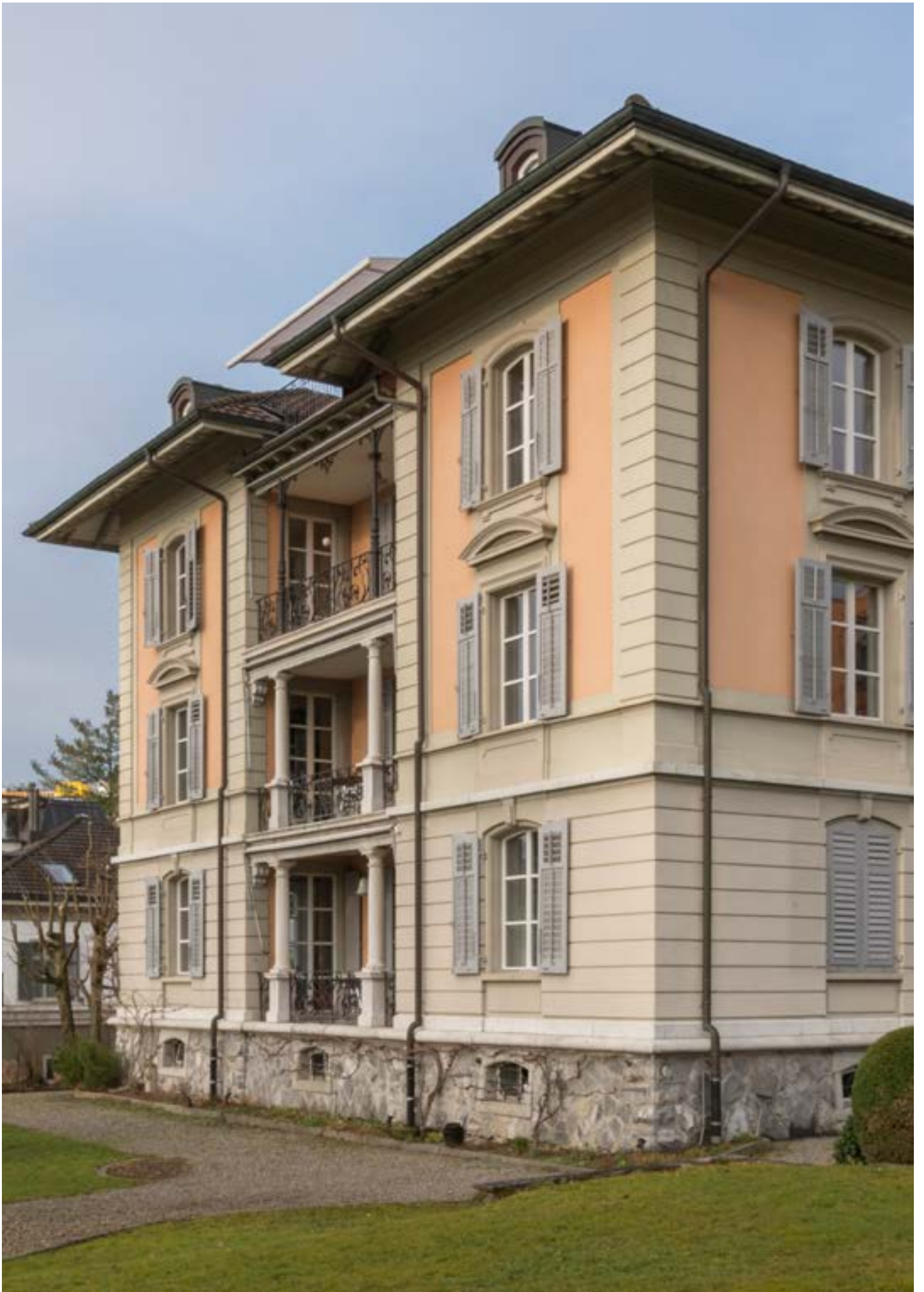
Umbau MFH Lindenfeldsteig, Luzern