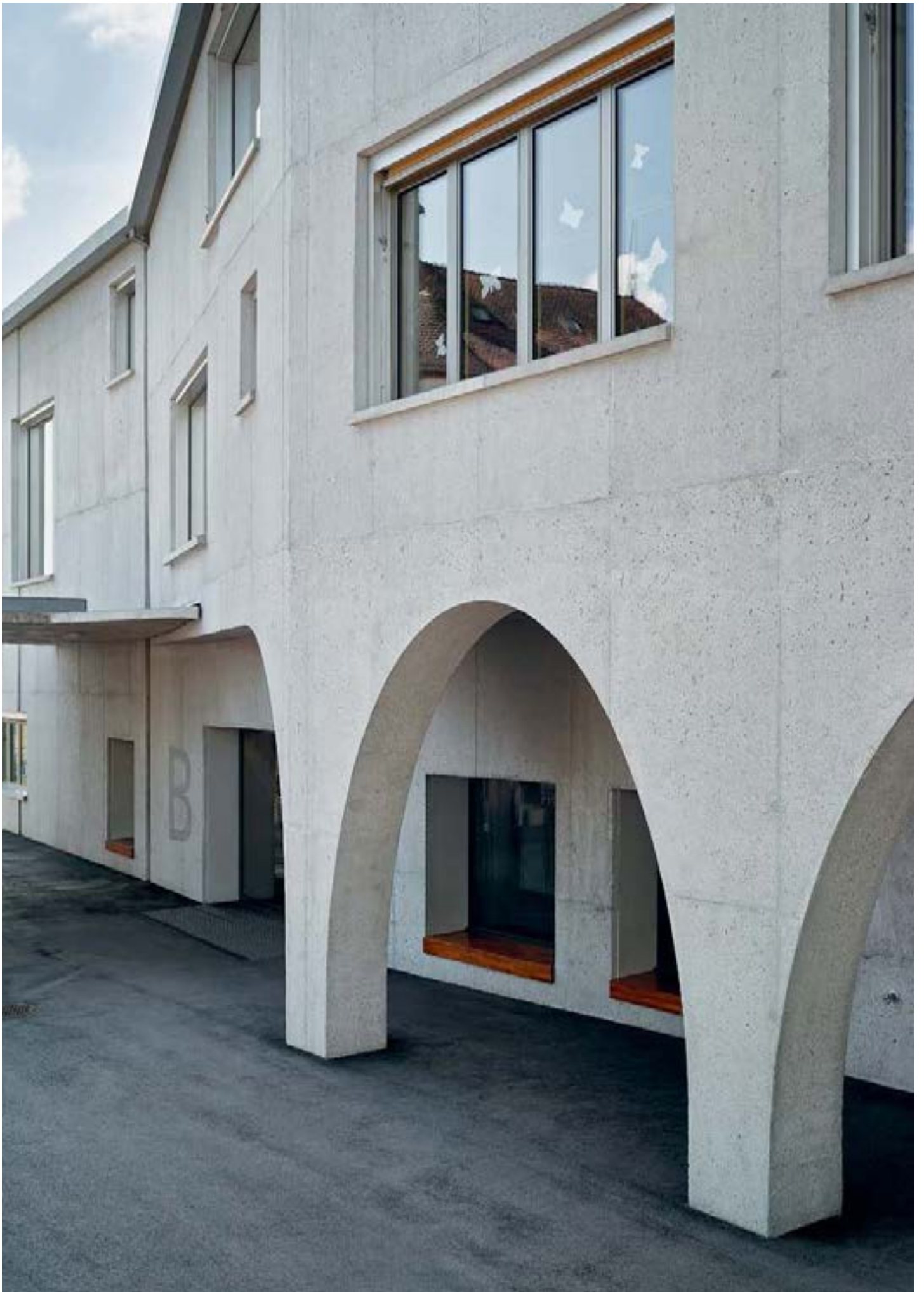
Neubau Schulhaus Trakt B, Buttisholz