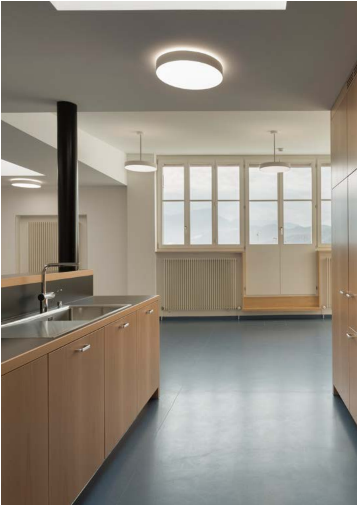
Umbauten Armeeausbildungszentrum, Luzern